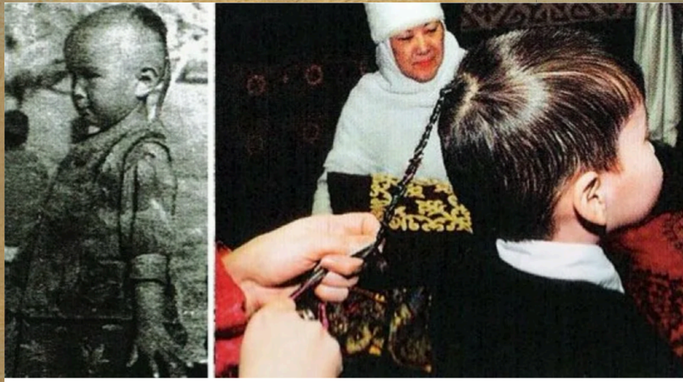
Айдар - адамның төбесіне қойылған шаш