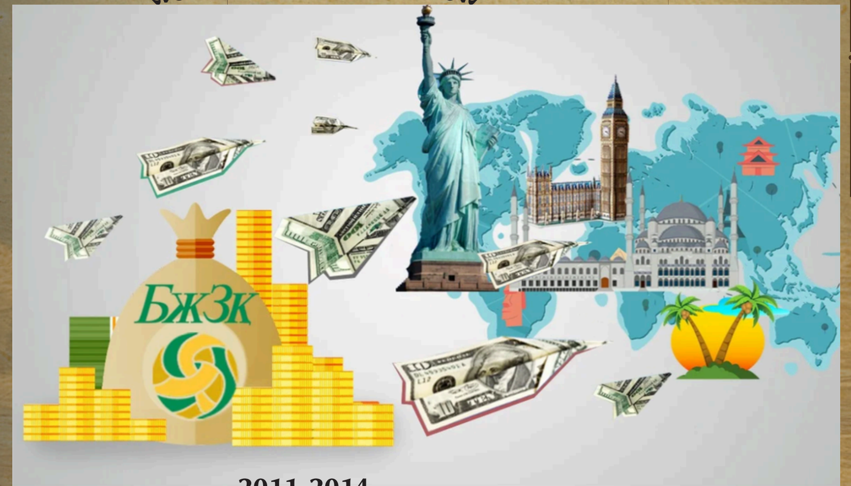
Құн - баға, ақша