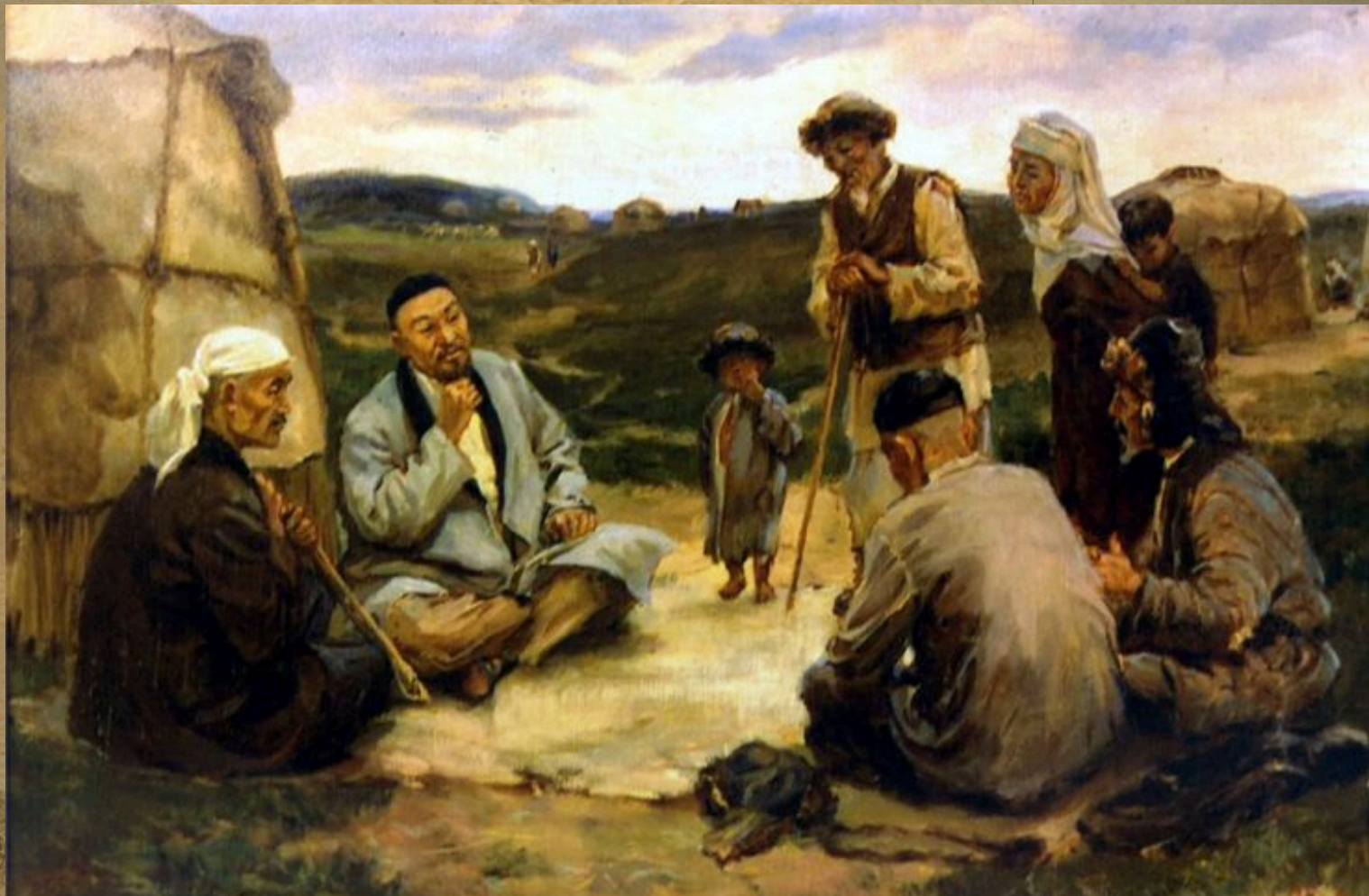
«Құн төлеу» салты