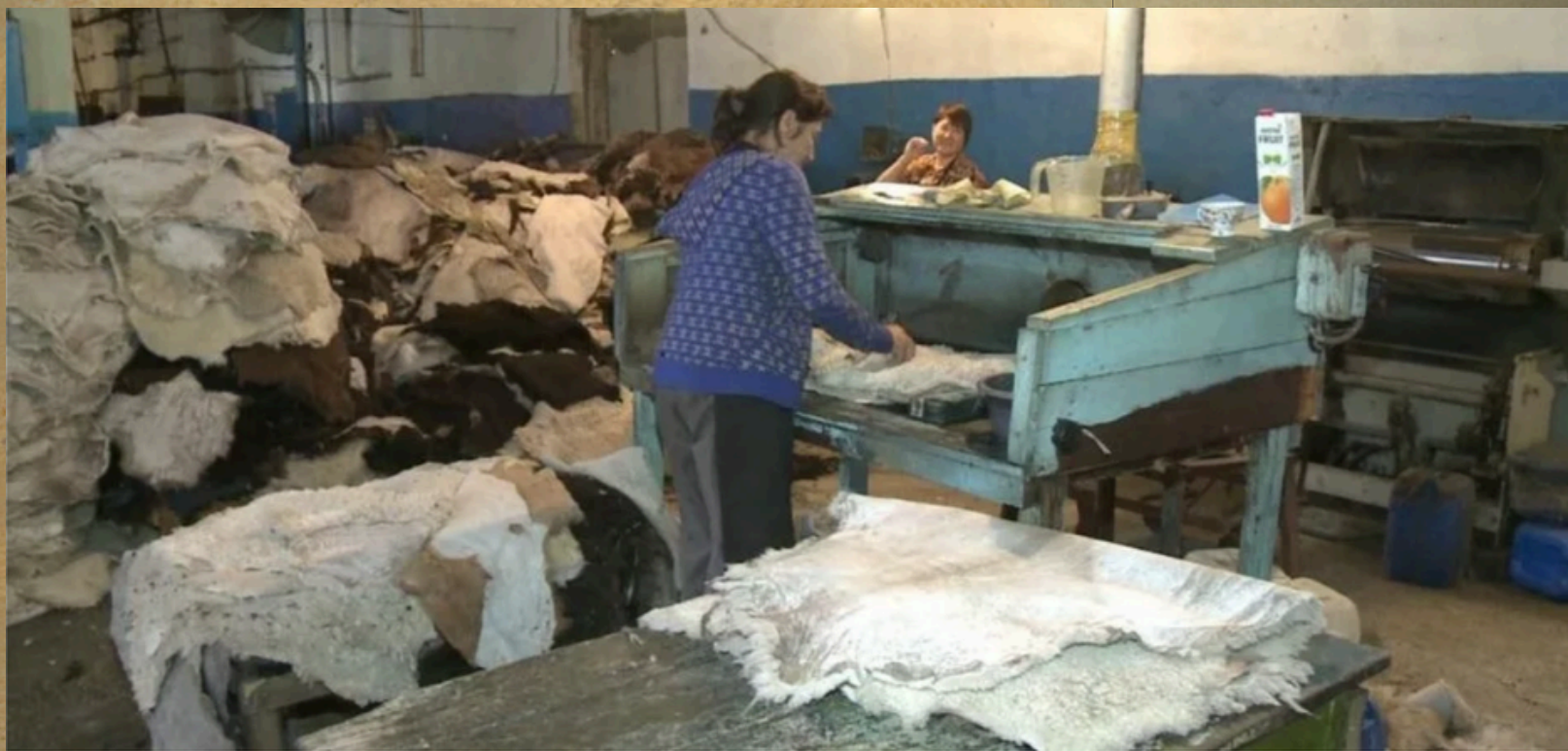
Талқылау - тері илеу