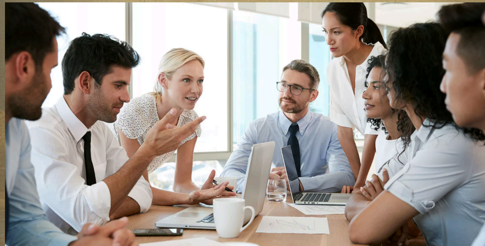
Талқылау - мәселені талқылау