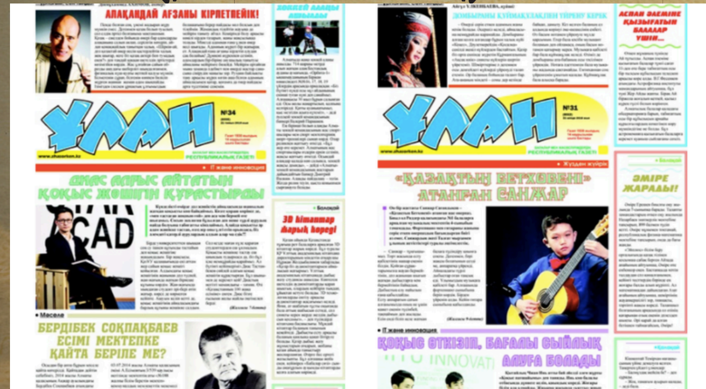
Айдар — газет, журнал, телебағдарлама, сайттағы рубрика немесе тақырыптық бөлімнің аты.