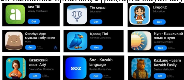
1-сурет. Қазақ тілін дамытуға арналған онлайн платформалар.

Онлайн платформалардың негізгі артықшылығы – олардың қолжетімділігі мен икемділігі. Әлемнің кез келген нүктесінде интернетке қосылған кез келген адам қазақ тілін үйрене алады. Бейнесабақтар арқылы тілдің фонетикалық және грамматикалық ерекшеліктерін түсіндіру оңайға түседі. Интерактивті жаттығулар мен деңгейлік тестілер оқушылардың білімін бағалап, олардың тіл меңгеру деңгейін анықтауға мүмкіндік береді. Мысалы, «Shyra q ai, ANA TILI, ChatGPT, Fobizz, Classroomscreen, Til-qazyna, Claude ai» және тағы басқа жасанды интеллект арқылы қызмет ететін платформалар (1-сурет. Қазақ тілін дамытуға арналған онлайн платформалар) қазақ тілін үйренуге арналған түрлі деңгейдегі сабақтар ұсынады. Бұл платформа арқылы қолданушылар тілдің негізгі ережелерін үйреніп, сөйлесу дағдыларын жетілдіре алады. Сонымен қатар, синхронды сабақтар арқылы нақты уақыт режимінде мұғаліммен байланыс орнатып, сұрақтарға жауап алу мүмкіндігі бар.